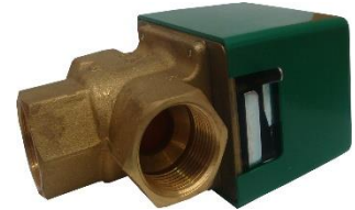
260097 Válvula Esfera Motorizada

Control de circuitos y sistemas de calefacción. La válvula Puede ser cruzada en un solo sentido. Puede usarse en aplicaciones de diferentes líquidos (mezclas de agua y glicol)