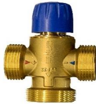
260056 Thermostatic Mixing Valve

Como elemento mezclador central, la válvula mezcladora termostática automática, NovaMix valve, mantiene la temperatura de agua de mezcla constante.