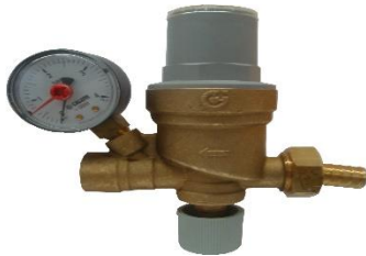
260115 Unidad de llenado automático

Las válvulas de llenado conectan el sistema sellando el escape de agua hasta alcanzar la presión requerida y también proporciona protección contra corriente inversa.