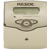
260072 Control solar Delta sol Es.

Apoyo al circuito de calefacción, regulación de intercambio térmico, post-calentamiento termostático, caldera de combustible sólido, protección anticongelante, limitación de temperatura entre otras.